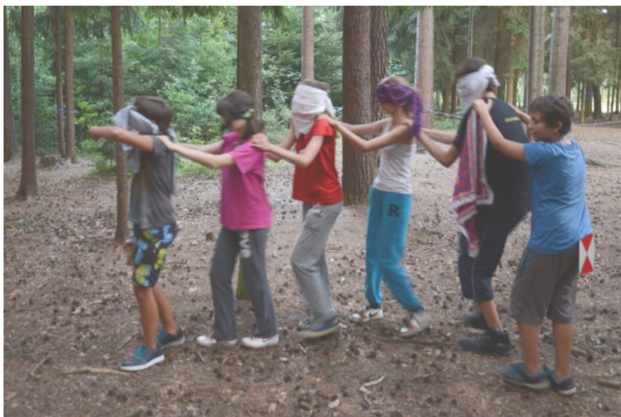
Záběry ze včerejší homologační jízdy.

tá na předpokládaný nápor milionů vlakuchtivých diváků. „Abychom zabránili případným sebevrahům ve skoku do kolejiště, byly kolem trati všude nataženy elektrické ohradníky s vysokým napětím,“ vysvětluje bezpečnostní opatření šéf místní policie Habakkuk ibn Heisa. „Připraveny jsou také speciální jednotky s důkladně vycvičenými bojechtivými prasaty.“ Pro návštěvníky bylo mimo jiné zřízeno i stanové městečko a po celém městě vyrostly stánky s rychlým občerstvením. „Nemáte tušení, kolik baget jsme za po-